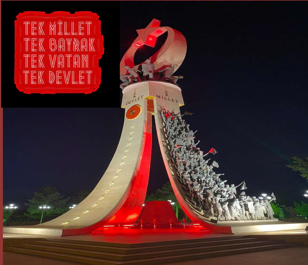
15 TEMMUZ ŞEHİTLER ABİDESİ